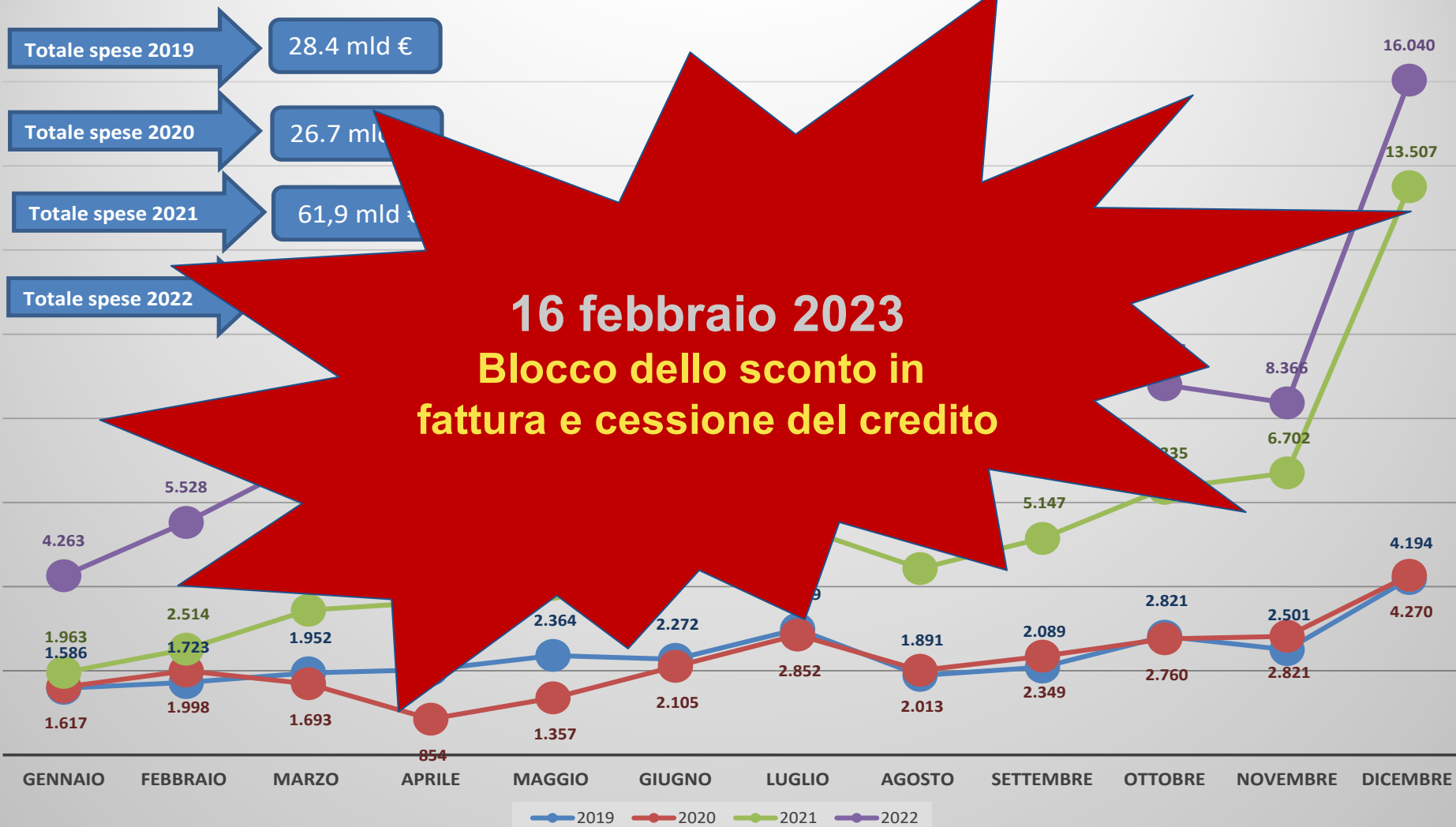
Andamento spese per lavori edili anni dal 2019 al 2022, dati in mln di euro