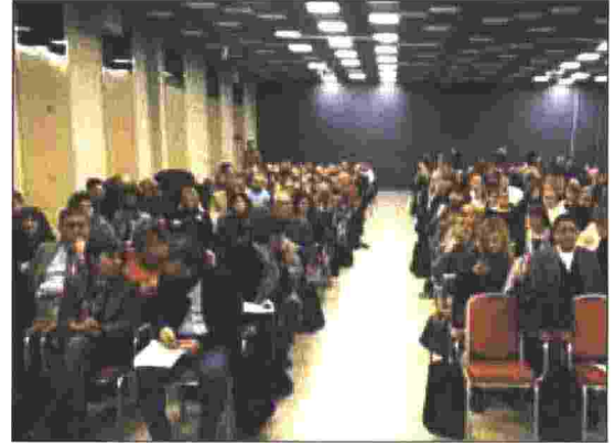
Alcuni momenti del Convegno Studi della Federazione Italiana Tributaristi a Milano